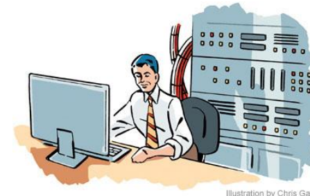
Illustration by Chris Gash